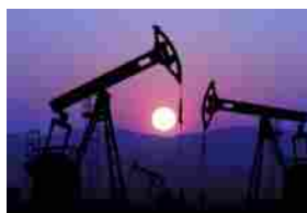
OIL & GAS - TENARIS ANCORA IN