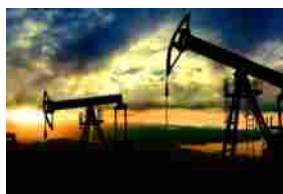
OIL & GAS - TENARIS, SAIPEM ED