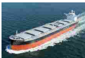
D'AMICO - CASSA PER $12,3 MLN