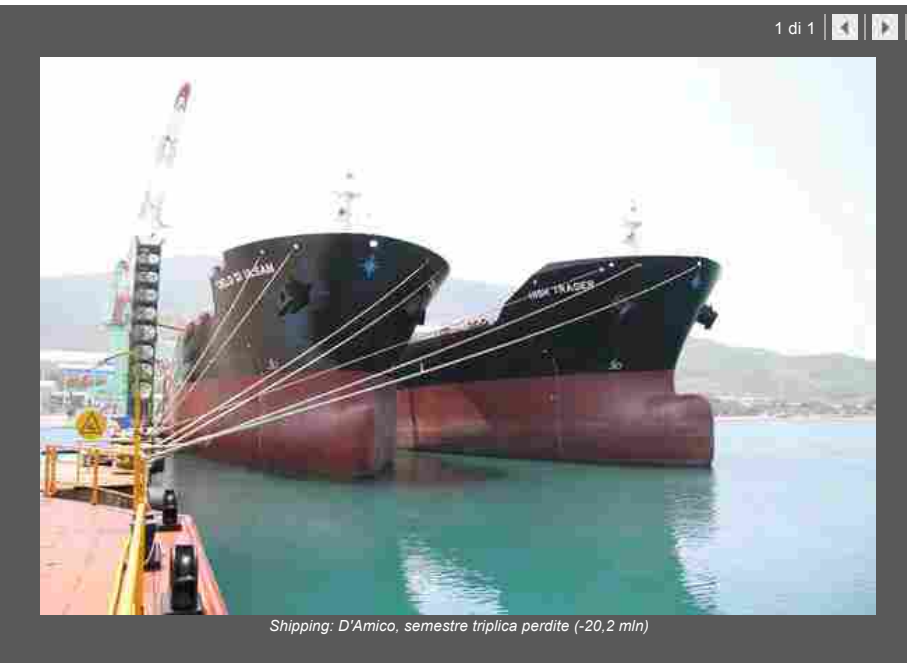
Shipping: D'Amico, semestre triplica perdite (-20,2 mln)

Indietro Stampa Invia Scrivi alla redazione Suggestisci ()