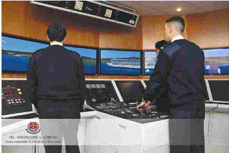
ITS - FONDAZIONE G. CABOTO SCUOLA SUPERIORE DI TECNOLOGIA PER IL MARE

Venerdì 17 Febbraio 2017 - Ultimo aggiornamento: 22:59