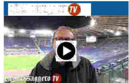
Roma-Torino 4-1: il videocommento di Ugo Trani