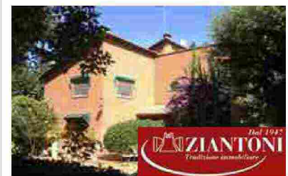
Villa, via Cecilia Metella